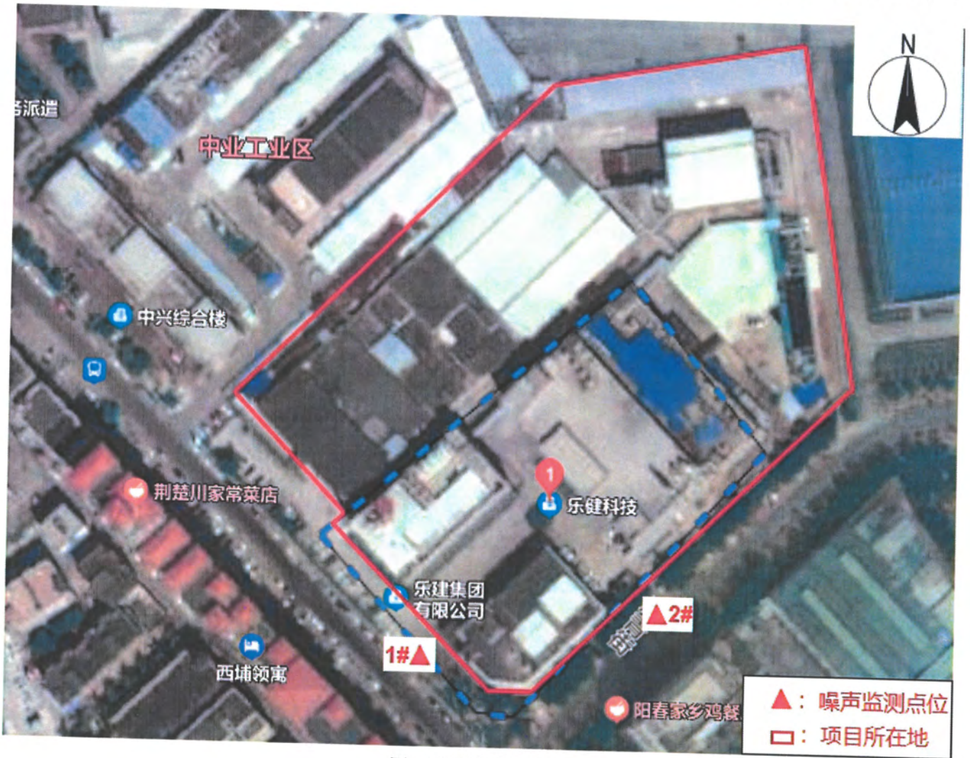
图3 检测点位示意图